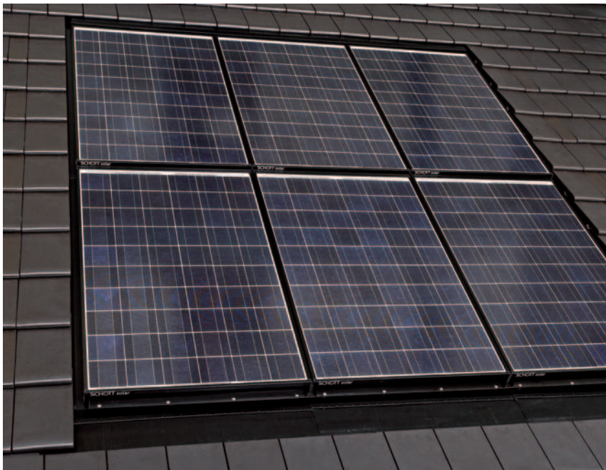
SCHOTT INDAX® 214/225/230/235